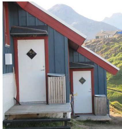
Figur 4: Eqqaavilerfiit qisunnik naqillugit aanaveersakkanik qalliuutillit (Tasiilaq).

Illoqarfinni Paamiuni Nuummilu containereeqqat 240-800 literit (marlunnik sisamanilluunniit assakaasullit) assersuutigalugu ilaqtariinnut arlalinnut illut meeqqeriviillu eqqaanni atorneqarput.