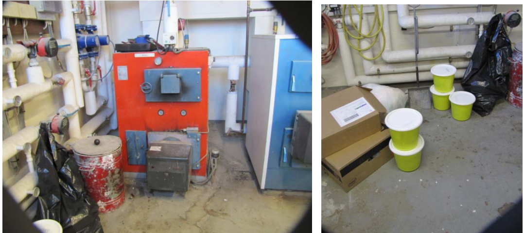
Figur 23: Tasiilami napparsimmavimmit eqqakkanik ikuallaavik aamma spandiaqqat sungaartut napparsimmavimmit eqqakkanik katersuviit.

Nuummi, Paamiuni, Tasiilami aamma Ittoqqortoormiini napparsimmavinni assigiinngitsuni eqqakkat navianaateqarsinnaasut piviusumik nammineq suujunnaarsinneqartarput. Eqqakkat navianaateqarsinnaasut napparsimmavinni immikkoortortaqaarfanni poortuutissanut siunertamut immikkut pisiarineqarsimasunut poortorlugit katersorneqartarput.