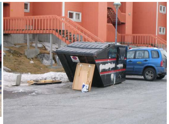
Figur 8: Nuummi containeri uertittagaq.