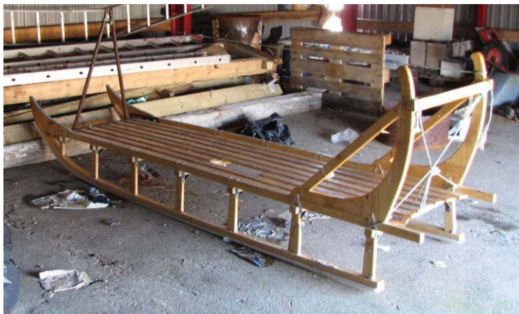
Figur 12: Qamutit eqqakkanik anartarfiillu imaannik katersinerni atorpeqartarpoq.

Tunami nunaqarfinni ukiukkut qamutit karsitalikkat eqqakkanik poorsuarniittunik katersinerni atorpeqartarput. Qamutit qamuterallannit kalinneqartarput. Nunaqarfinni tamani kommunimi ingerlatsinermut immikkoortorta qamuterallaateqarpoq.