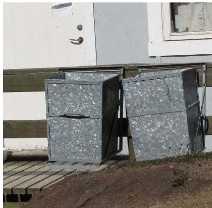
Figur 3: Tasiilami eqqaavilerfiit zinkimit sanaat.