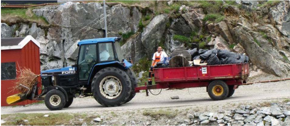
Figur 17: Arsummi upernaakkut saliineq.