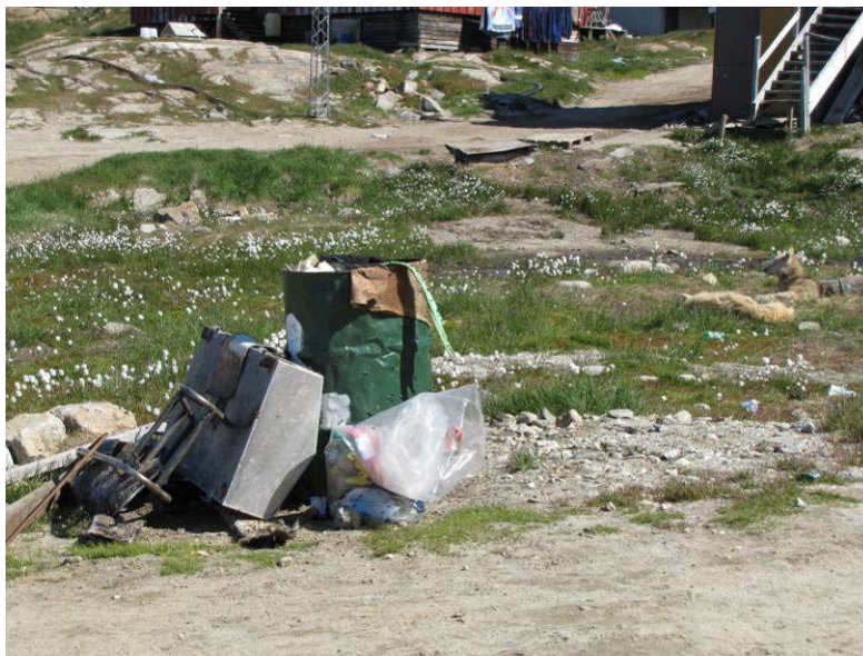
Figur 19: Kuummiuni eqqakkat annertuut aaneqartussanngorlugit inissitat.

Innuttaasut eqqakkanik annertuunik aaneqartussanngorlugit inissiisimasut illoqarfinni nunaqarfinnilu innuttaasut aqqusinilerisut naalagaasaat attaveqarfigisinnaavaat igitassallu inissinneqarsimasut pillugit ilisimatillugu.