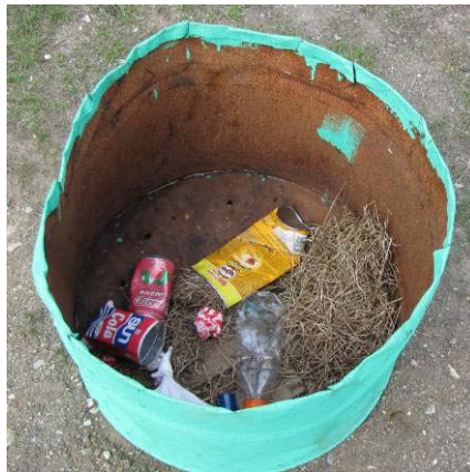
Figur 20: Illoqannginnersani kikkunnilluunniit atorneqarsinnaasuni eqqaaviit imaarneqartartut (Tasiilami aamma Paamiuni).