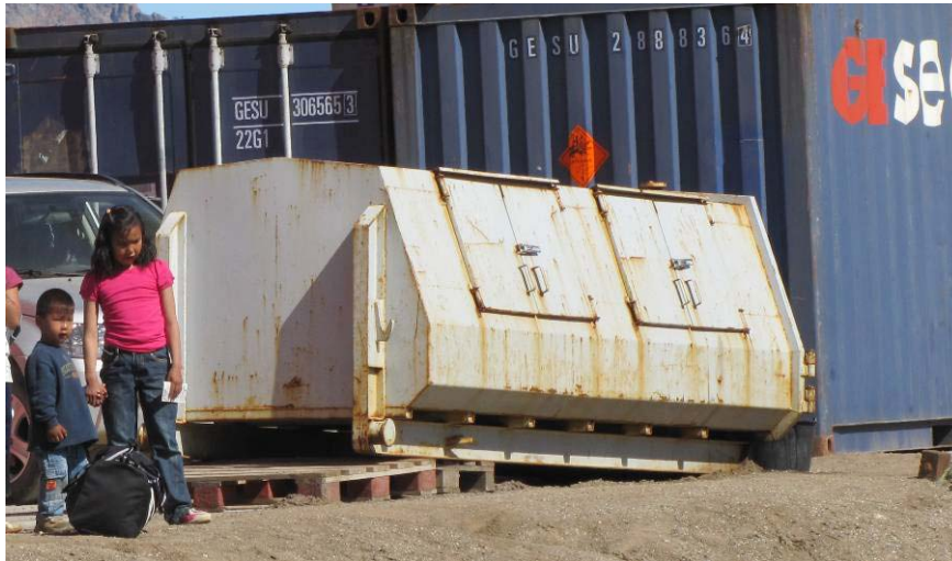
Figur 6: Maxi-containeri Tasiilami umiarsualivimmi.

Kiisalu Nuummi inissiat eqqaanni containerit uertinneqarsinnaasut 2-8 m 3 -it akornanni angissusillit atorneqarput.