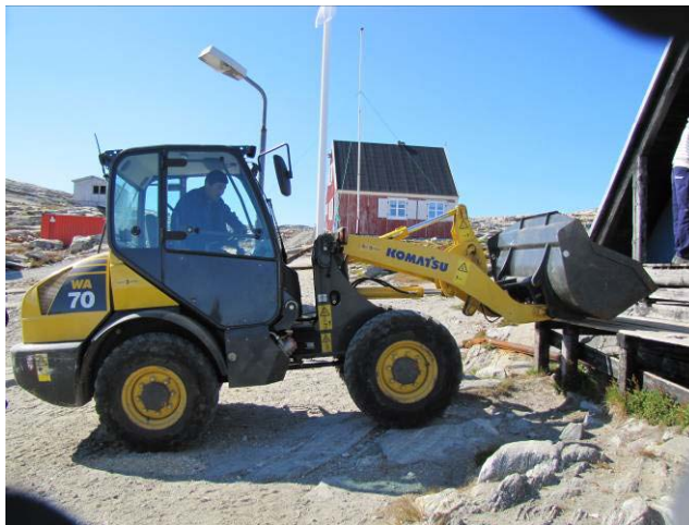
Figur 9: Nivattaateeraq - Isortoq.

Nunaqarfimmi Kapisilinni aamma Tasiilap eqqaani nunaqarfinni tamani nivattaateqqat atorneqarput. Nivattaateqqat taakku eqqakkanik (nivaatartaanut) aamma anartarfiit imaannik (nivaatartaanut taarsiullugu tankimut) katersinerni atorneqartarpoq. Tasiilami kommune namminerisaminik biilileriffiuteqarpoq (ilinniarsimasut marluk ilinniartullu aamma marluk), nunaqarfinni nivattaateeraq aserorpat (nivattaateeraq) atortullu aserfallatsaaliorneqarnissaannut sulisut nunaqarfiliartinneqartarput.