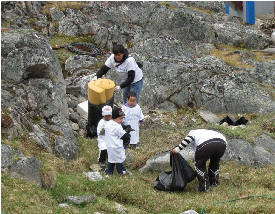
Figur 18: Arsummi upernaakkut saliineq.