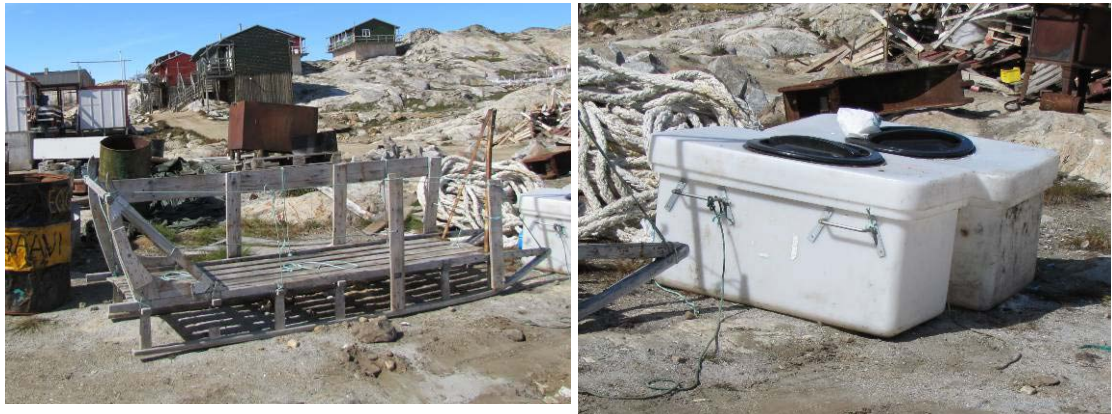
Figur 15: Qamutit tankitallit anartarfiit imaannut atugassiat (Tiniteqilaaq).

Ittoqqortoormiini kommunimi sulisut bili usisaalik (Mazda) anartarfiit imaannik katersinermiini atortarpaat. Ukiuunerani qamutit karsitallit qamuteralinnik kalillugit anartarfinnik annittakkanik katersissutigalugit atorneqartarput. Nunaqarfinni Arsummi Qeqertarsuatsiaanilu anartarfiit annittakkat traktorinik kalitalinnik katersorneqartarput.