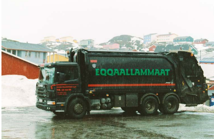
Figur 13: Nuummi eqqakkanik katersissutit qamutit motorillit naqitsissutitalit.

Nuummi, Tasiilami Paamiunilu eqqakkanik aamma eqqakkanut assigusunik eqqakkanik tamanik katersineq entreprenørinut namminersortunit isumagineqartarpoq. Entreprenørinut namminersortut qamutit motorillit naqitsissutitalit atorpaat.