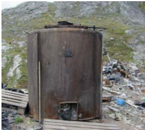
Figur 22: Arsummi anartarfiit puussiartaannik ikuallaavik.

Arsummi Paamiunilu anartarfiit puussiartaasa imaarneqareernerisigut tamakku ikuallaaviaqqami siunertamut tamatumunnga pilersinneqarsimasumi ikuallanneqartarput.