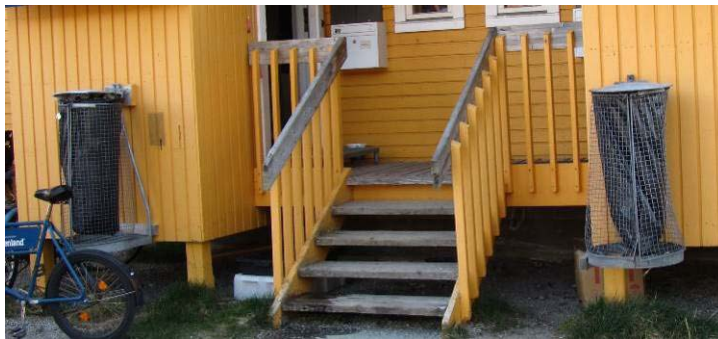
Figur 2: Saviminernik nettitalit (Paamiut).

Tunumi Tasiilami, Ittoqqortoormiini nunaqarfinnilu eqqaavilerfiit saviminernik nettitalit imaluunniit eqqaavilerfiit qisuit naqillugit aanaveersakkat aamma eqqaavilerfiit zinkinik sanaat poorsuarnik immerneqartartut atorneqarput. Maannakkut eqqaavilerfinnik zinkiusunik pisisoqarsinnaajunnaarpoq, tamakkumi sanaatorneqarunnaarsimagamik, taamaattumik eqqaavilerfiit taamatut ittut siunissami ungasinnerusumi eqqaavilerfinnik saviminernik nettitalinnit qisunnillu naqillugit aanaveersakkanik qalliusikkanit taarserneqassapput.