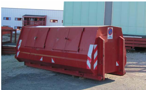
Figur 7: Paamiuni maxi-containerit.

Kiisalu Nuummi inissiat eqqaanni containerit uertinneqarsinnaasut 2-8 m 3 -it akornanni angissusillit atorneqarput.