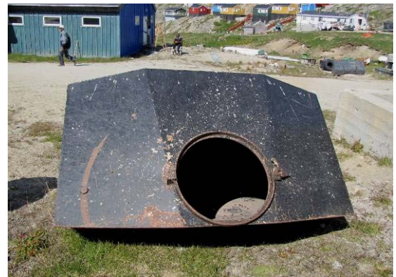
Figur 14: Anartarfiit imaannik katersinerni nivattaateeraq tankikalik aamma tanki qanimut assilisaq (Kuummiut).