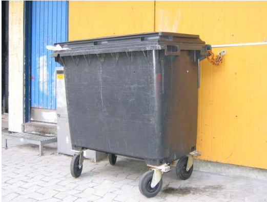
Figur 5: Containereeraq Nuummi inissiarsuit eqqaanniittoq.

Illoqarfinni Paamiuni, Nuummi Tasiilamilu inissiat imaluunniit sumiiffiit immikkut ittut eqqaannit eqqakkat annertunerusut maxi-containerit 10-20 m 3 -iusut atorneqarput.