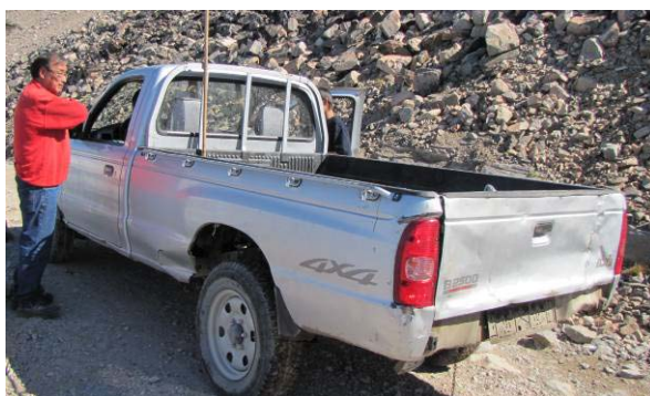
Figur 10: Mazda - Ittoqqortoormiit.

Ittoqqortoormiini kommunimi biili usisaatilik (Mazda) eqqakkanik anartarfiillu imaannik katersuinernut atorneqartarpoq. Usisaataa ulissualerneqartarpoq ulissuarlu taanna ullut tamaasa soraalernermi eqqiarneqartarpoq.