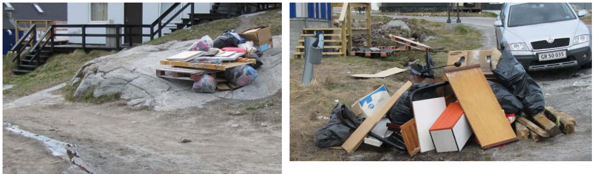
Figur 16: Nuummi eqqakkat annertuut aqquserngup sinaaniittut.

Nuummi ilaqtariinnut ataatsinut arlalinnullu illut eqqaannit eqqakkat annikitsut ikuallanegarsinnaasut tunniunegarsimasuni poorsuarniittut, eqqakkat annertuut ikuallanegarsinnaasut, eqqakkat ikuallanegarsinnaanngitsut aamma eqqakkat navianartut ukiumut marloriarlugit katersorneqartarput. Upernaakkut saliineq iluatsillugu upernaakkut katersisoqartarpoq.