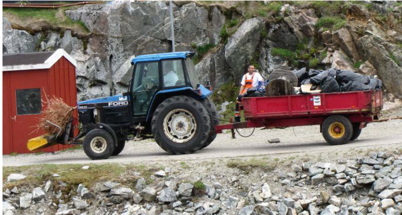
Figur 11: Traktori kalitalik - Arsuk.

Tunami nunaqarfinni ukiukkut qamutit karsitalikkat eqqakkanik poorsuarniittunik katersinerni atorpeqartarput. Qamutit qamuterallannit kalinneqartarput. Nunaqarfinni tamani kommunimi ingerlatsinermut immikkoortorta qamuterallaateqarpoq.